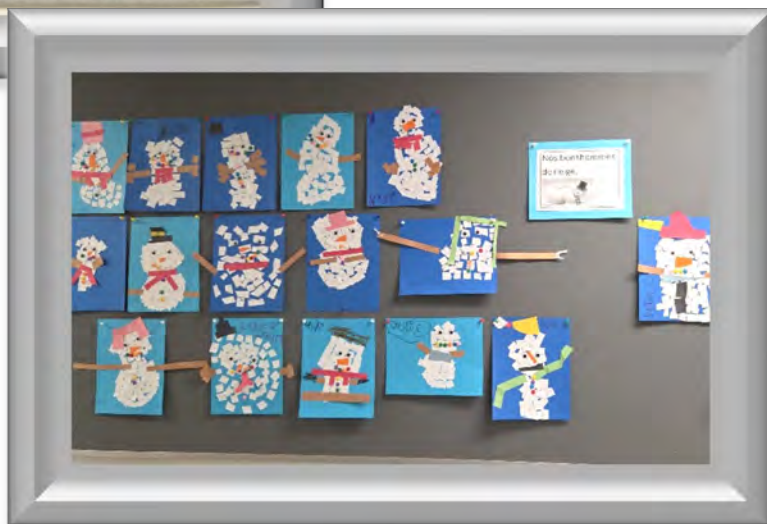
À la maternelle, on crée des bonhommes de neige (groupe 011)