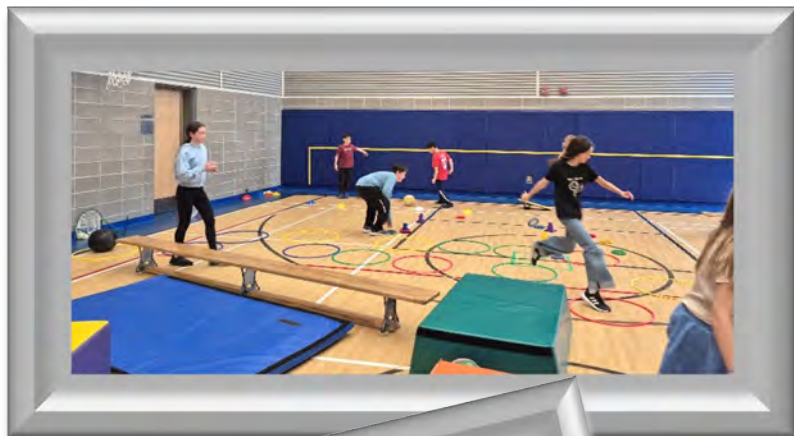
En novembre, ça bouge en 5 e année : on s'amuse dans des parcours créés par les élèves au gymnaste!