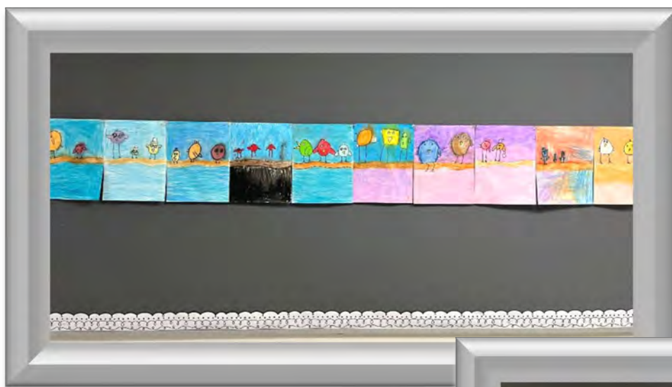
Des oiseaux sur une branche d'automne au pastel gras et sec par le groupe 202