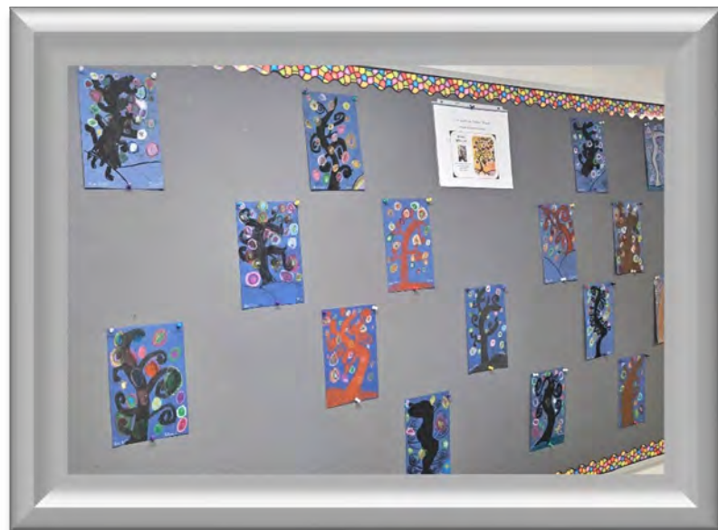
Les arbres à bijoux du groupe 301, à la manière de Natacha Wescoat