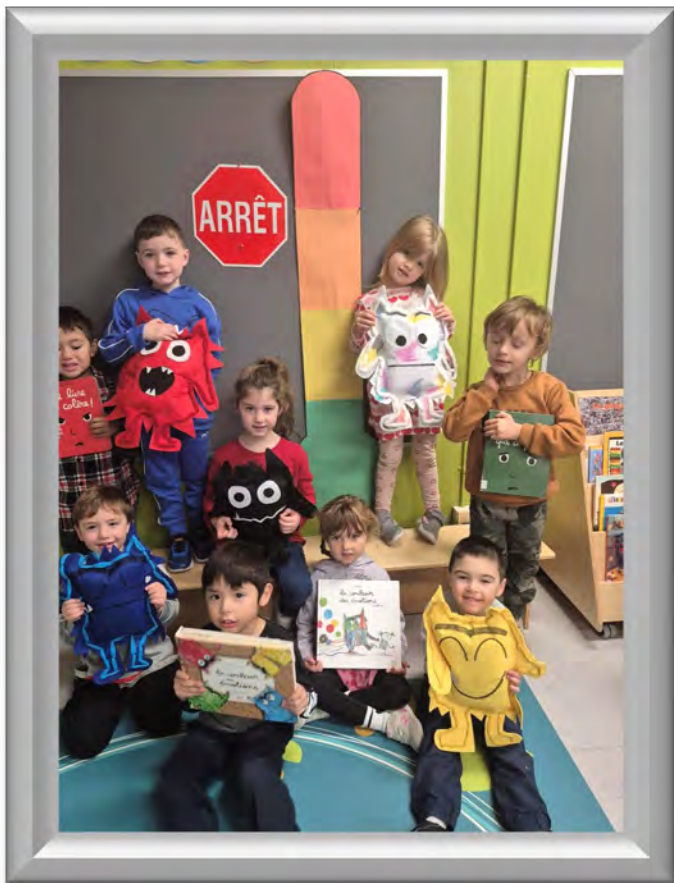
En maternelle 4 ans, on découvre les émotions!

La classe de maternelle 4-5 ans est prête à vous accueillir pour un sELFie!