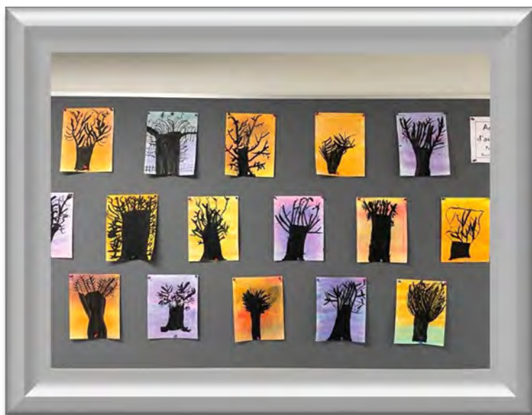
Des arbres au pastel sec et encre de chine en 1 re année